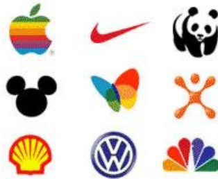
آرم تصویری (شمایی)