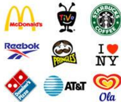
آرم ترکیبی (لوگومیکس)