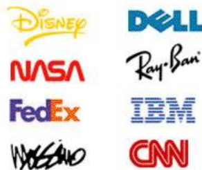
آرم نوشتاری (لوگوتایپ)

لوگوتایپ / نماد کلمه ای / نوشتاری ، که در صنعت طراحی نماد کلمه ای نیز گفته می شود، نام برند یا شرکت شما را تبدیل به یک نوع تلقی با نوع فونت و سبک یکتا می کند. انواع فونت در هزاران نوع، شکل، اندازه، و سبک ممکن که هر یک تاثیر اندکی متفاوت روی مخاطب مورد نظر دارند. فونت های دستخطی حالت رسمی و تهنیدی دارند. فونت های ضخیم تداعیگر قدرت و نیرومندی است در حالیکه فونت های اریبی حس انگیزش و حرکت را القا می کنند. انواع فونت همچنین شامل حروف دست نویس، کاراکتر و نمادهایی می شوند که به گونه ای تبدیل شده اند که چشم را بفریبند و جلب توجه کنند. همچنین، تصاویر را نیز، برای تاثیر بصری بهتر، می توان به این نوع لوگوها تبدیل کرد. در هنگام انتخاب یک لوگوتایپ یا نماد کلمه ای باید به خوانایی و سادگی تشخیص آن، حتی در شرایطی که باید در اندازه کوچک روی کارت های تجاری چاپ شود، توجه نمود .