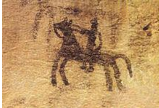
دیوارنگاره‌ای در غار دوشه واقع در لرستان، حدود هشت هزار سال پیش از میلاد

بین سده شانزدهم تا سده نوزدهم اهمیت طراحی در مقایسه با اهمیت رنگ‌پردازی بحث اصلی هنرمندان غربی بود و بر این مبنا هنر فلورانس نیگولا پوسن و انگر از هنر ونیزی روبنس و دلاکروا متمایز شد. در شرق دور از گذشته تاکنون مرزی میان نقاشی و طراحی وجود نداشت و قلم مو وسیله اصلی هر دو شاخه محسوب می شده است.