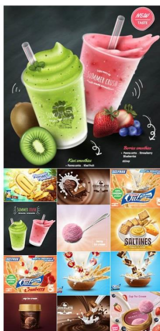
Advertising Food Poster Vector (EPS) PERSIANA

قابل توجه مدرسین محترم : حداقل 4 صفحه در هر هفته برای ارائه محتوای درس و یک صفحه برای خلاصه درس و نمونه سولات در نظر گرفته شود.