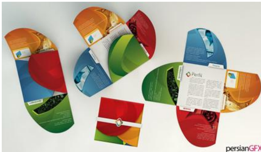
کاتالوگ و بروشورهای خلاقانه

به کاربردن تصاویر زیبا و با کیفیت و استفاده از فونت های نوشتاری مختلف برای عناوین اصلی و فرعی و استفاده از سطوح گرافیکی و جلوه های زیبای بصری و استفاده از گرید های منعطف در طراحی صفحه بندی کاتالوگ و بروشور باعث جذابیت و جلوه هر چه بیشتر آن و جلب مخاطب می شود.