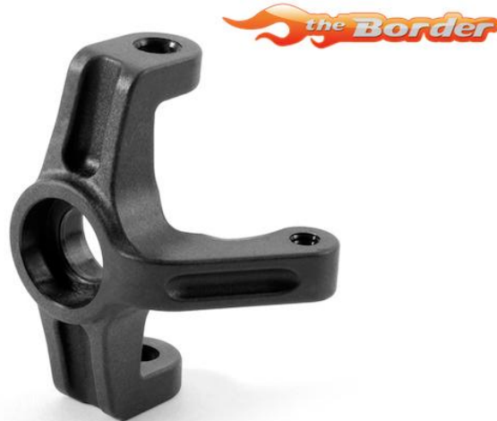
عکاسی تبلیغاتی (صنعتی)