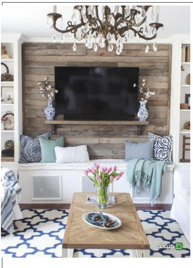
طراحی شلوغ اطراف تلویزیون