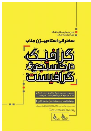
طراح: بیژن جناب

بیژن جناب (زاده ۱۲ دی ۱۳۳۰ در تهران) طراح گرافیک ایرانی و استاد دانشکده هنرهای زیبا در دانشگاه تهران، دانشگاه الزهراء، دانشگاه آزاد اسلامی و دانشگاه صدا و سیما است. او یکی از اعضای مؤسس انجمن صنفی طراحان گرافیک ایران است و در حال حاضر به عنوان یک عضو هیئت منصفه عمل می‌کند.