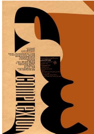
طراح : رضا عابدینی

رضا عابدینی (متولد سال ۱۳۴۶، تهران) طراح گرافیک و مدیر هنری معاصر ایرانی است. او فارغ‌التحصیل رشته طراحی گرافیک از هنرستان هنرهای تجسمی پسران تهران و لیسانس نقاشی از دانشگاه هنر تهران است و فعالیت حرفه‌ای خود را از سال ۱۳۶۸ آغاز کرده‌است. فعالیت‌های او بر طراحی گرافیک از جمله طراحی پوستر، نشانه و کتاب با تأکید بر روش تایپوگرافی متمرکز است. از کارهای قابل توجه او می‌توان به طراحی نشانه گالری طراحان آزاد اشاره کرد.