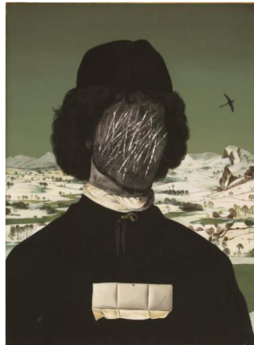
طراح: آیدین آغداشلو

حاجی واشنگتن (۱۳۶۱)؛ به کارگردانی علی حاتمی - طراحی پوستر