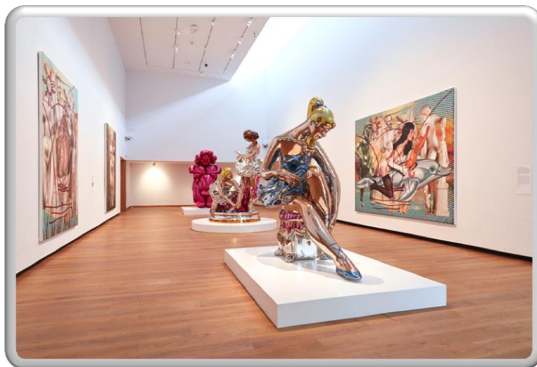
At The Ashmolean Exhibit (Jeff Koons)

موزه ها به عنوان یک پدیده نوظهور در دنیای هنر نقش ها و کارکردهای گوناگون و متفاوتی را بر عهده دارند. کارکردهایی از جمله نمایش آثار، نگه داری، آموزش و پرورش را می توان بر شمرد که موزه ها را بیش از پیش به یک نهاد اجتماعی موثر و تاثیرگذار بر جنبه های گوناگون جوامع امروزی تبدیل کرده است. ( نوظهور بودن موزه به عنوان یک نهاد فرهنگی، اجتماعی با نهادینه شدن موزه ها در اروپا با گشودن مجموعه های خصوصی به روی مردم در دوره رنسانس، سده های ۱۷ و ۱۸ میلادی، انقلاب صنعتی در انگلستان و اروپا آغاز شد. و تداوم آن با گشایش موزه آشمولین در آکسفورد انگلستان و موزه لوور در پاریس فرانسه ادامه یافت. موزه در ایران به عنوان یک نهاد رسمی فرهنگی، اجتماعی با تاسیس موزه ایران باستان در سال ۱۳۱۶ خورشیدی در ایران ظهور کرد. )