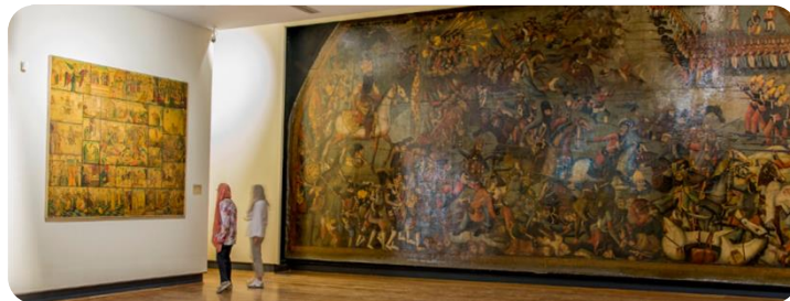
موزه ملی ایران

موزه ها را بر اساس موضوع، شکل و مخاطب طبقه بندی می کنند که در این راستا موزه های هنری از گونه های مهم به شمار می آیند. موزه های هنری با ارائه آثار هنری به سیر تاریخ هنر، بررسی آثار هنری هنرمندان، سبک شناسی هنر در دوره های گوناگون می پردازند.