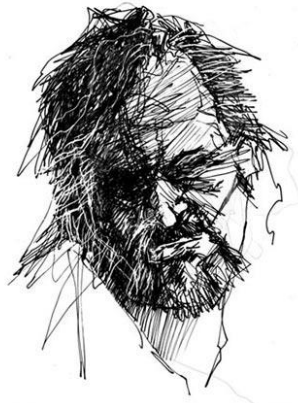
نمونه طراحی اکسپرسیو

این نوع خطوط در طراحی بیشتر نشان دهنده حالت های عاطفی و روحی هنرمند است. خطوط با ضربه هایی سریع و مقطع بر روی کاغذ کشیده میشوند، ضخامت خطوط به تندی کم و زیاد شده و ظاهر کلی طرح دارای یک نوع خشونت خاصی است . خطوط با قاطعیت و صراحت به کار گرفته میشود و با حرکات تند دست بر روی کاغذ جاری می شوند و در حقیقت این نوع طراحی بازگو کننده تصور و احساس آنی هنرمند است و آنرا ( طراحی اکسپرسیو) می نامند.