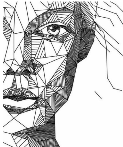
نمونه طراحی کنستراکتیو

این نوع خطوط همان طور که از نام آن پیداست هنگام ترکیب دارای انضباط و نظمی ساختمانی هستند، یعنی کلیه خطوط با سازمانی محکم و حساب شده در جهات مختلف در کنار هم قرار می گیرند و بافت متشکل و منظمی را بوجود می آورند. این خطوط بر خلاف خطوط با حالت، بیشتر منطقی و تابع نظم و قاعده خاصی هستند که قبلا توسط هنرمند پیش بینی شده است، البته این بدان معنی نیست که در این نوع خطوط هیچگونه احساس و شخصیت هنرمند وجود نداشته باشد. بلکه باید گفت نوع احساس و شخصیت هنرمند در قالب خطوط منظم ارائه شده به خوبی به چشم می خورد.