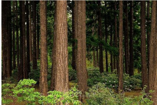
عنصر خط در طبیعت