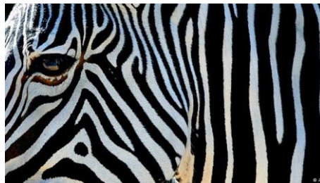
عنصر خط در طبیعت

همانگونه که در مبحث نقطه اشاره شد، عنصر خط نیز نسبت به زمان و مکان متغیر است. به عنوان مثال، اگر به یک ردیف درخت از فاصله دور نگاه کنیم، به صورت خطوطی منظم دیده میشوند. در حالی که هر اندازه به این درختها نزدیک شویم، خطوط نیز در واقعیت درخت، حل شده و در نهایت تنه درختها را می بینیم که خط نبوده و هر یک دارای حجمی استوانه ای هستند. همینطور است در باره خطوط راه آهن و خیابانها، که اگر از پنجره هواپیما به آنها نگاه کنیم به شکل خطوطی متنوع ( راست، منحنی و زاویه دار ) دیده می شوند. ولی اگر در کنار ریل راه آهن ویا در همان خیابان به ایستید، خطها مبدل به سطوح شده و نزدیکترین قسمت آن به ما به صورت حجم دیده میشود. بنا بر این خط نسبت به زمان و مکان میتواند از یک عنصر یک بعدی به سطح و سپس به حجم تبدیل شود. خط دارای اشکال مختلفی است که عبارتند از: خط عمودی، افقی، مایل، منحنی و شکسته.