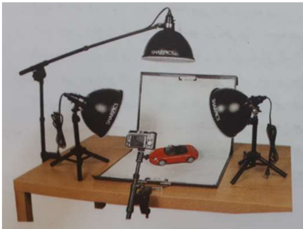
یک استودیوی کوچک خانگی

گاهی می‌توان با امکانات بسیار کم و با دوربین‌های معمولی عکس‌هایی ساده و زیبا گرفت با فراهم کردن این امکانات ساده در خانه می‌توان به تمرین نورپردازی پرداخت و از اشیا و اجسام با بافت و جنسیت‌های متفاوت عکاسی کرد و نور مناسب برای هر جنسیت را پیدا کرد شما هم می‌توانید با امکانات موجود در خانه مثل چراغ مطالعه استفاده کنید و از اجسام کوچک عکاسی کنید