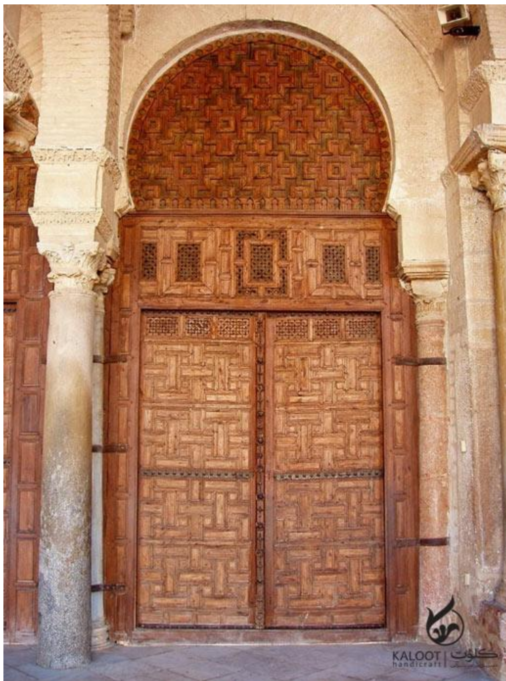
یکی از درهای منبت کاری شده مسجد جامع عتیق شیراز

یعنی حدود ۱۲۰۰ سال پیش است. این در دارای زیرسازی از چوب تبریزی است و روی آن رگه هایی از چوب گردو یافت می شود.