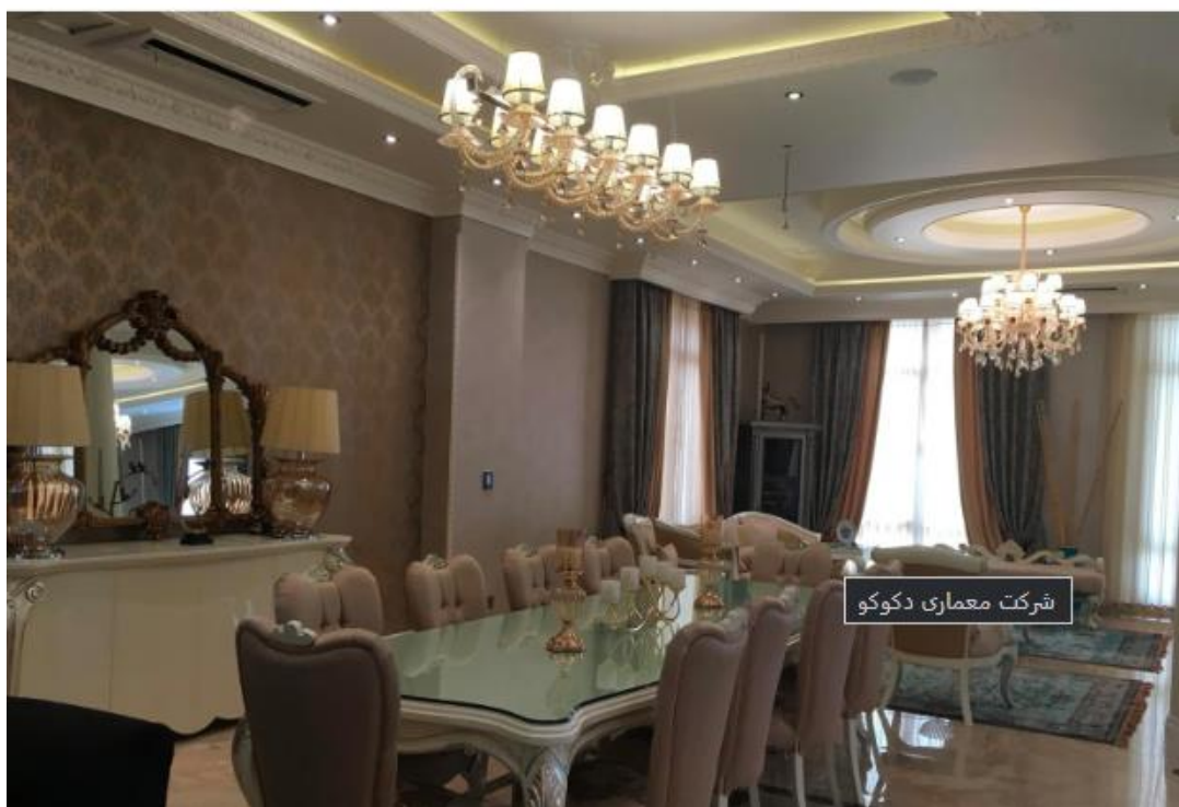
نور عمومی در فضای داخلی

نور را می‌توان براساس منبع تولیدکننده‌اش به دو دسته عمده تقسیم کرد؛ نور طبیعی و نور مصنوعی. ما در نور طبیعی که از خورشید تامین می‌شود، امکان دخل و تصرفی نداریم؛ مگر اینکه با ابزارهایی مثل پرده از ورود آن جلوگیری کنیم یا آن را به داخل فراخوانیم یا با شیشه‌های رنگی فضایی جذاب ایجاد کنیم اما آنچه موضوع بحث ماست، نورپردازی مصنوعی یا نورپردازی داخلی ساختمان است که در ادامه انواع آن را معرفی می‌کنم.