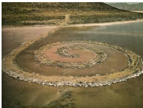
اسکله حلزونی، اثر رابرت اسمیتسون