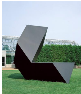
مینیمال در تبلیغات مفهومی