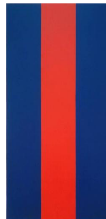
الهام بارنت نیومن