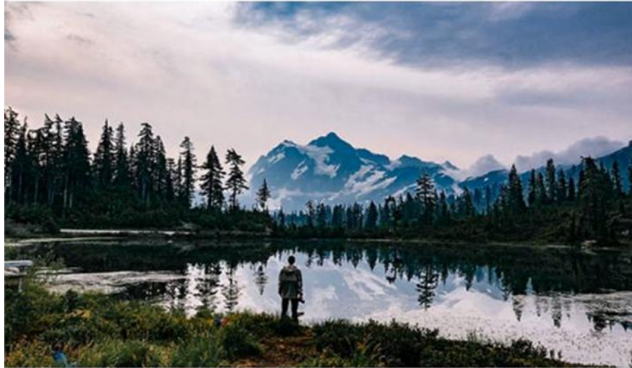
آموزش عکاسی قدم به قدم

گام بعدی تعیین هدف است. چقدر می خواهید از علایق خود عکاسی کنید؟ این کار می تواند یک سرگرمی یا یک کار حرفه ای باشد، بنابراین الویت و هدف را مشخص کنید. آیا می خواهید عکاسی مراسم هایی مثل عروسی و ... را انجام دهید یا اینکه علاقه مند به عکاسی صنعتی هستید؟