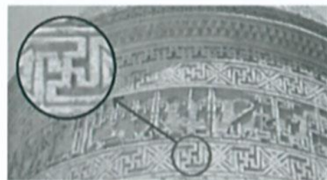
نماد صلیب در آجر کاری سلجوقی