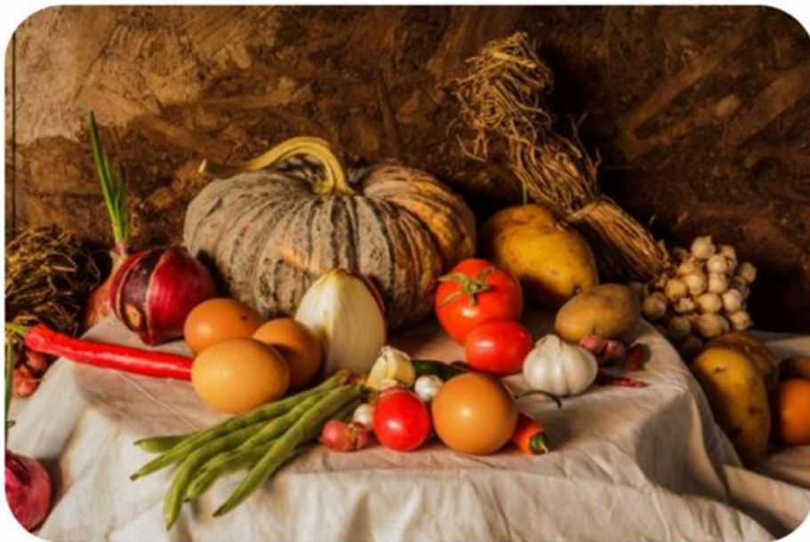
ترکیب بندی در عکاسی

ترکیب بندی این گونه تعریف می شود: چگونگی جای دهی اشیا و عناصر در عکس.