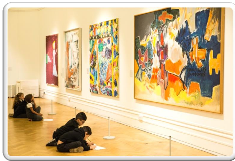
Bristol Museum and Art Gallery hosts creative writing initiative

در برنامه ریزی برای طراحی، ساخت و اجرای هر موزه ای مخاطب شناسی و جلب رضایت مخاطب از ارکان اساسی به شمار می آید. به این منظور موزه های تخصصی بر اساس نوع مخاطب و برای نیل به اهداف از پیش تعیین شده ایجاد می شوند. در این میان موزه کودکان، موزه نایبانیان، موزه معلولان، موزه بانوان، موزه سالمندان و غیره... موزه هایی هستند که بر اساس نیاز مخاطبان طراحی و ساخته شده اند.