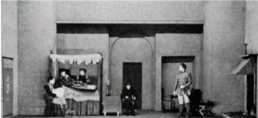
▲ شکل ۳-۱۰ - طراحی صحنه قابل تعویض و تبدیل به صحنه دیگر.