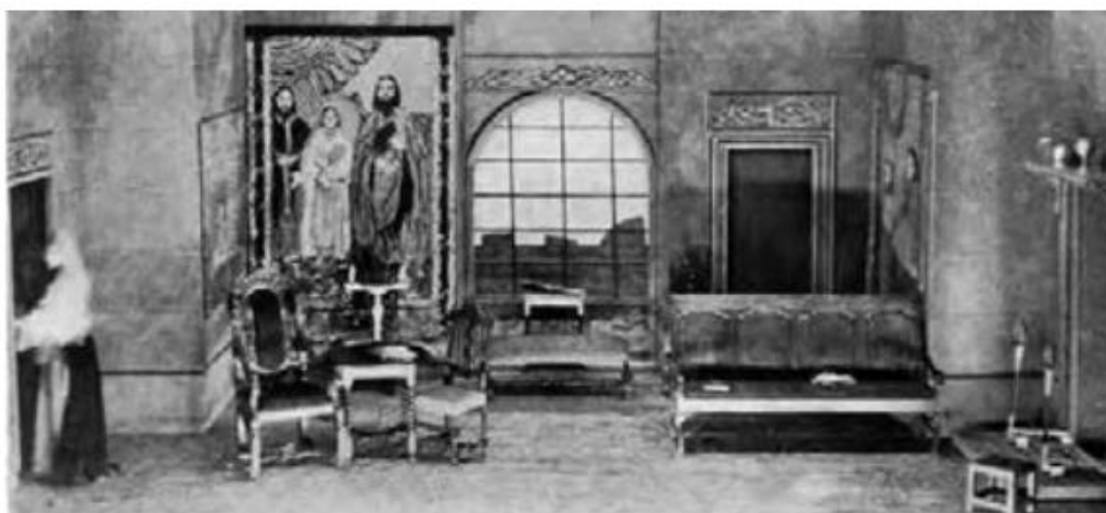
▲ شکل ۳-۲۲- رجوع به توضیح زیر شکل شماره ۳-۲۱