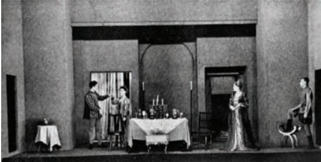
▲ شکل ۳-۹ - با مقایسه این شکل و دو شکل بعدی می‌توان متوجه شد که با تغییر لوازم صحنه و اضافه و کم کردن در یا پرده و شکل ظاهری لته‌ها چگونه صحنه‌های مختلف یک نمایش قابل تبدیل به صحنه‌های دیگری هستند.