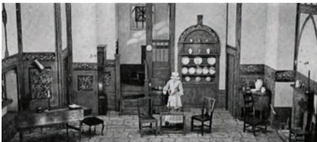
▲ شکل ۳-۸ - طراحی صحنه جداگانه برای هر یک از صحنه‌های نمایش