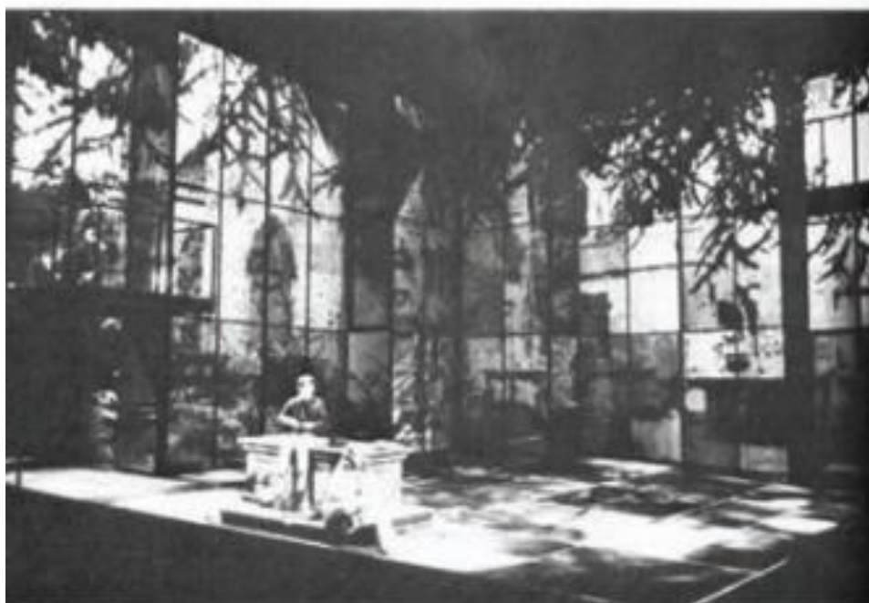
دو نمونه طراحی صحنه با استفاده از تلفیق دکور با تاباندن تصاویر روی دکور