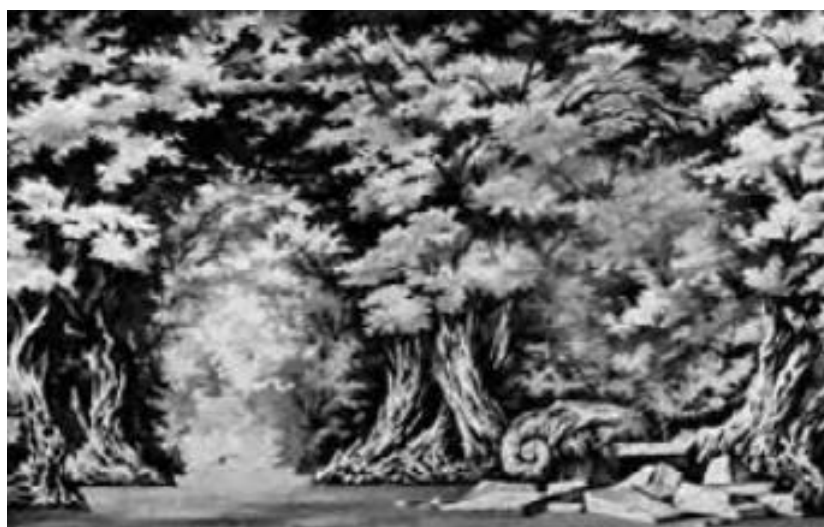
▲ شکل ۱۲-۳- طراحی صحنه فقط با استفاده از نقاشی