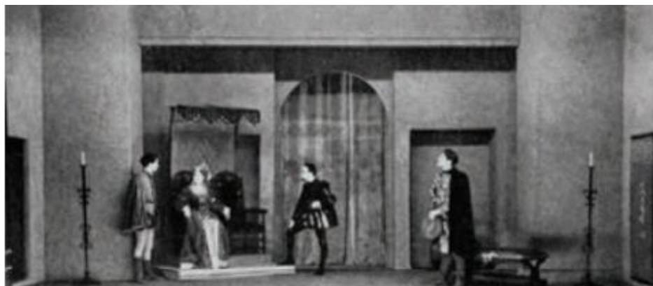
▲ شکل ۱۱-۳- طراحی صحنه قابل تعویض و تبدیل به صحنه دیگر