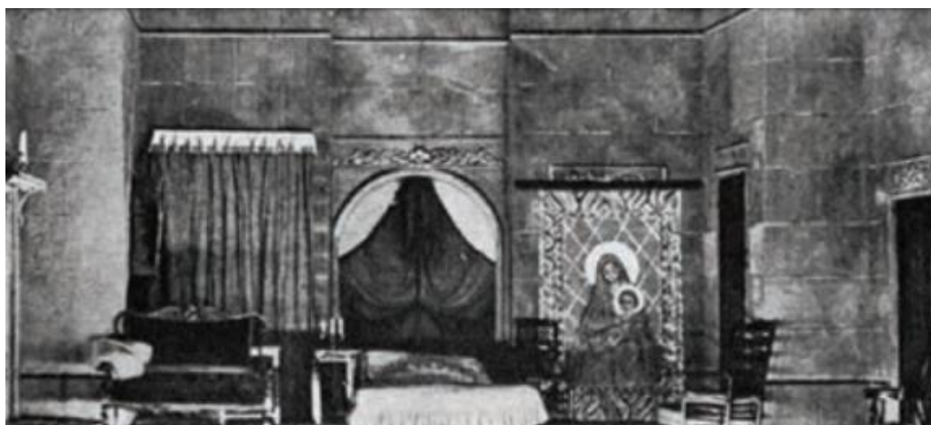
▲ شکل ۳-۲۱- با دقت به این تصویر و در تصویر بعدی می‌توان متوجه شد که اسکلت اصلی دکور ثابت است ولی با تغییر لوازم صحنه و تعویض پنجره با پرده، در با کتابخانه، در با تابلوی نقاشی و ... صحنه‌ای تبدیل به صحنه دیگری می‌شود.