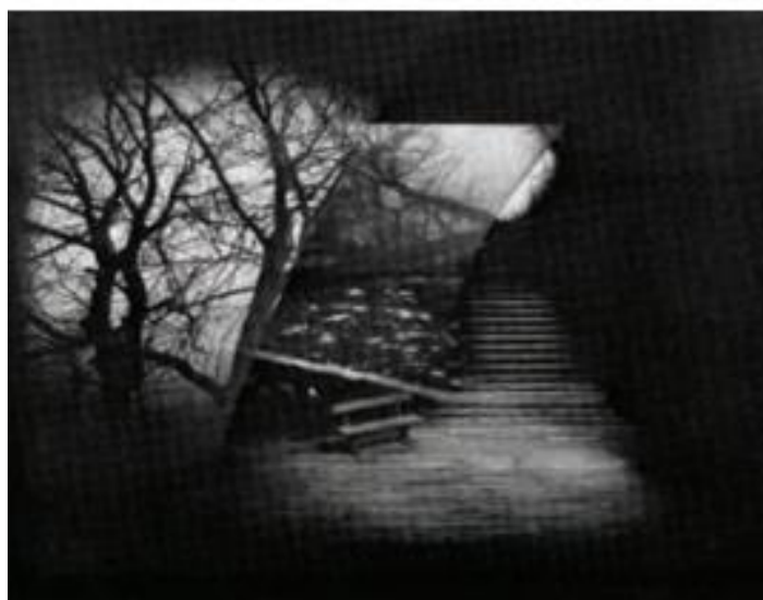
سه نمونه طراحی صحنه با استفاده از تلفیق دکور با تاباندن تصاویر روی دکور