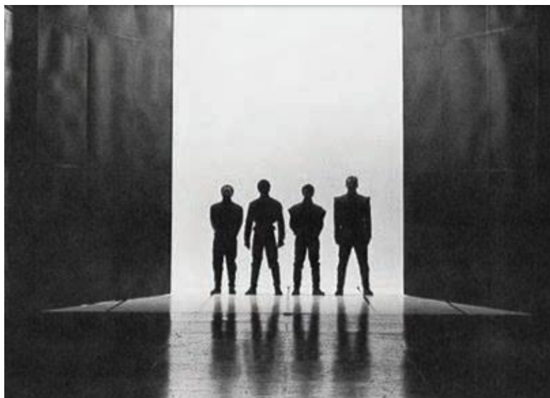
شکل ۳۹- طراحی صحنه به وسیله نور