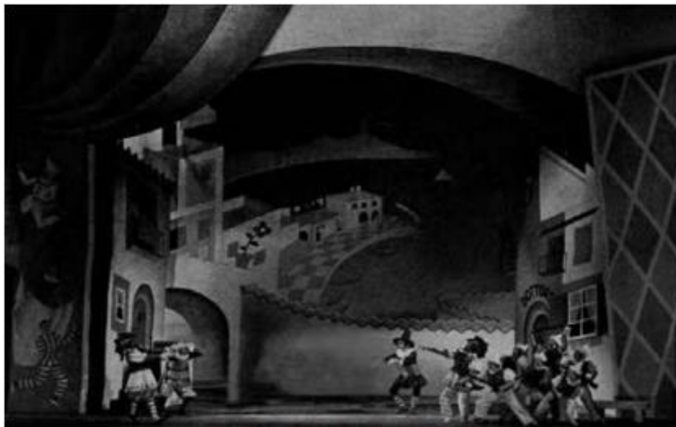
شکل ۱۴-۳- طراحی صحنه با استفاده از تلفیق دکور و نقاشی