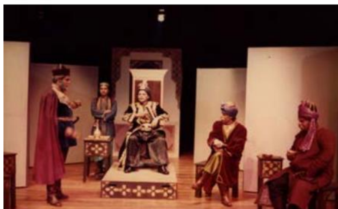
شکل ۳۳- رجوع به توضیح زیر شکل شماره ۳۲- ◀