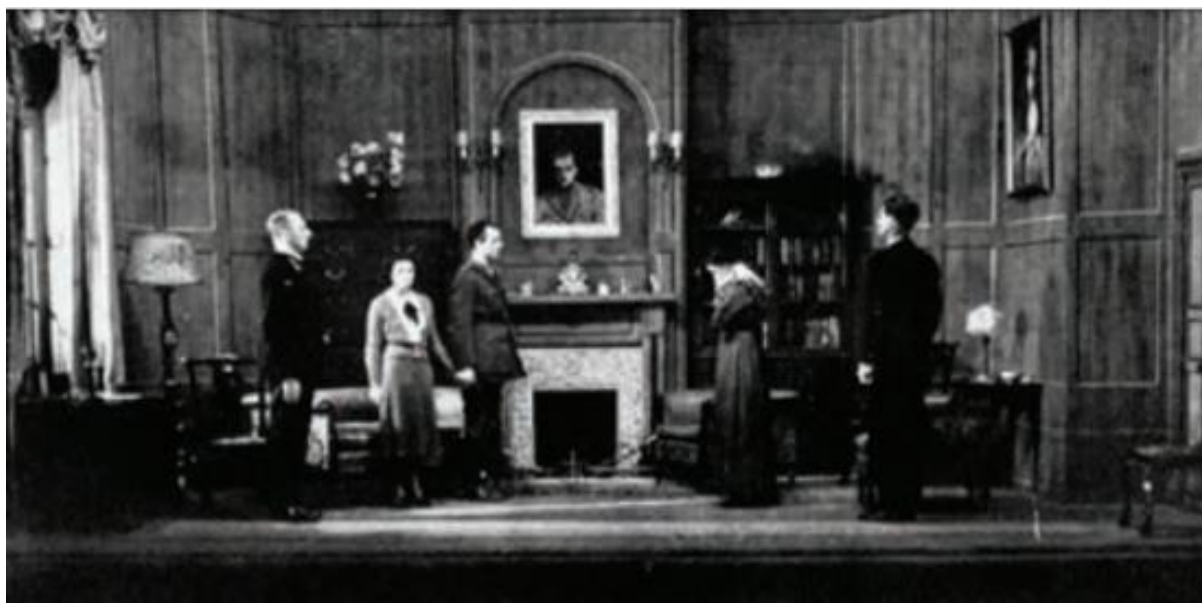
▲ شکل ۳-۷ - طراحی صحنه جداگانه برای هر یک از صحنه‌های نمایش

دانشجویان گرامی این تصاویر صرفاً برای درک بیشتر شما در مطالب آورده شده