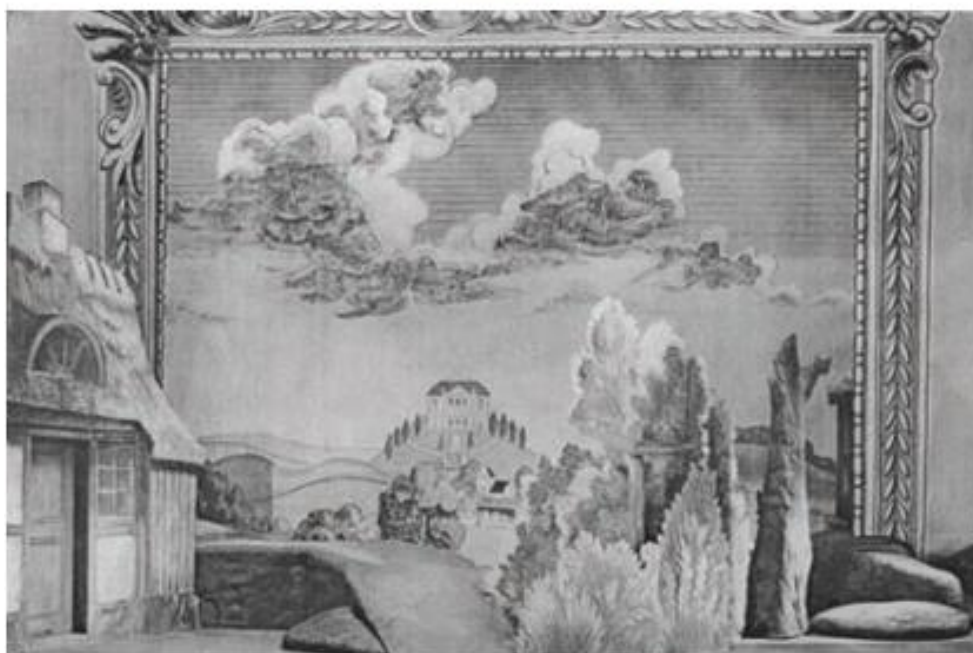
شکل ۱۵-۳- طراحی صحنه با استفاده از تلفیق دکور و نقاشی