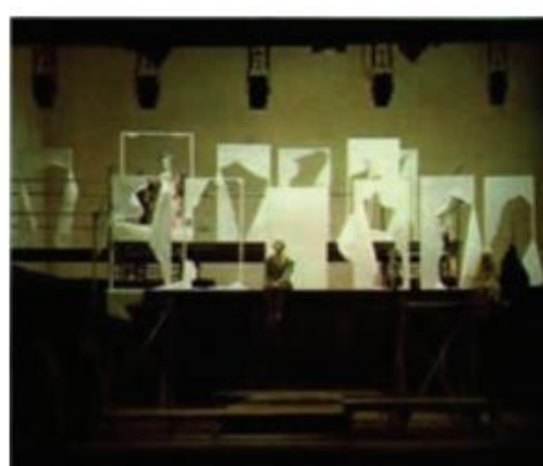
▲ شکل ۲۴-۳ الی ۳-۲۷ - اسکلت دکور در این چهار صحنه نمایش ثابت است ولی با تعویض لوازم صحنه و اضافه و کم کردن چند لته و دکور ساده صحنه‌ای به صحنه دیگر تبدیل شده است.