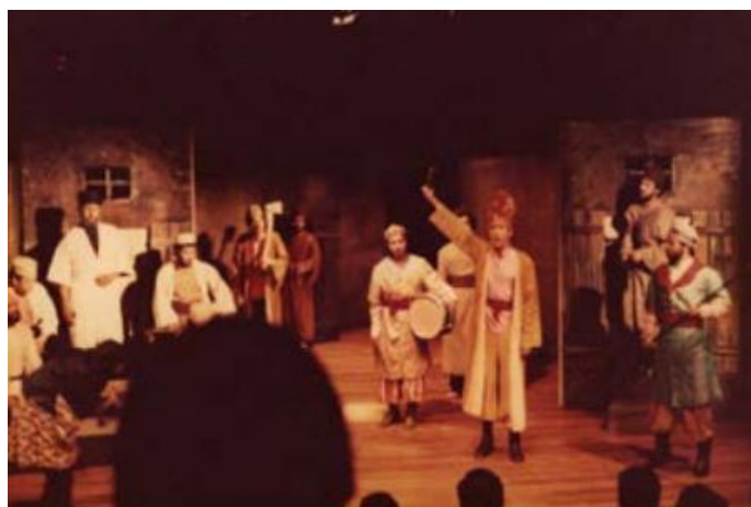
شکل ۳۲- طراحی صحنه متحرک، قابل تبدیل و تغییر صحنه‌ای به صحنه دیگر. طراحی صحنه برای نمایشنامه نهضت حر و فیه نوشته شهید حسین قشقایی. طراحی صحنه: فریدون علیاری، کارگردان: داود دانشور. تهران، سالن چهارسو، فروردین و اردیبهشت ۱۳۵۸ (صحنه بازار) ◀