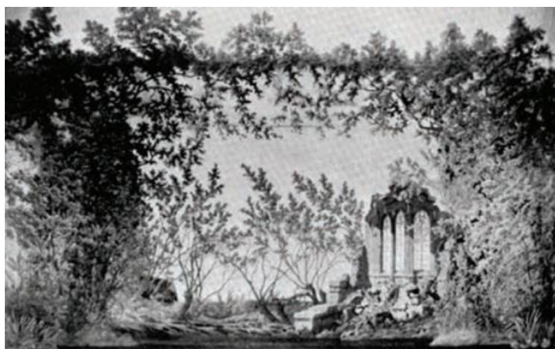
▲ شکل ۱۳-۳- طراحی صحنه فقط با استفاده از نقاشی