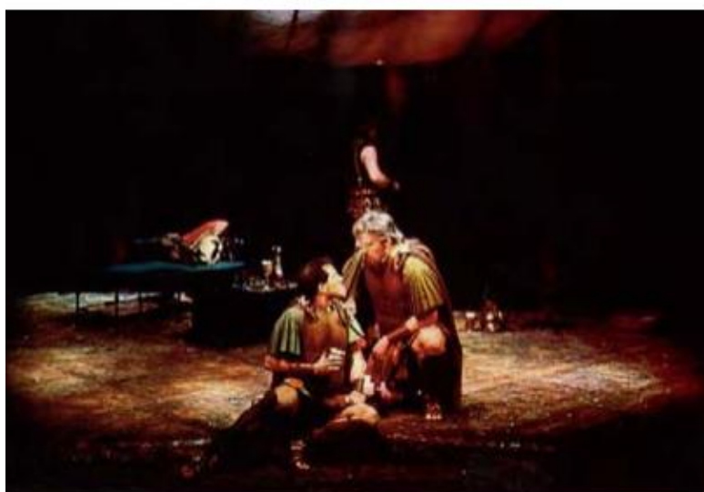
شکل ۴۰- طراحی صحنه به وسیله نور