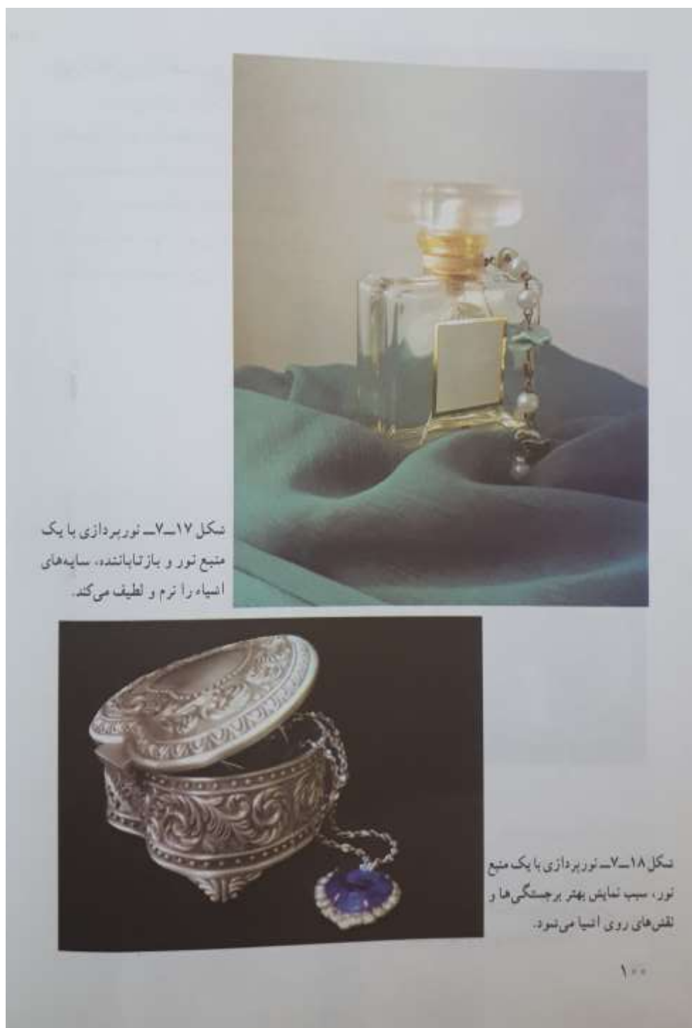
شکل ۱۷-۷- نورپردازی با یک منبع نور و بازتاباننده، سایه‌های اشیاء را نرم و لطیف می‌کند.