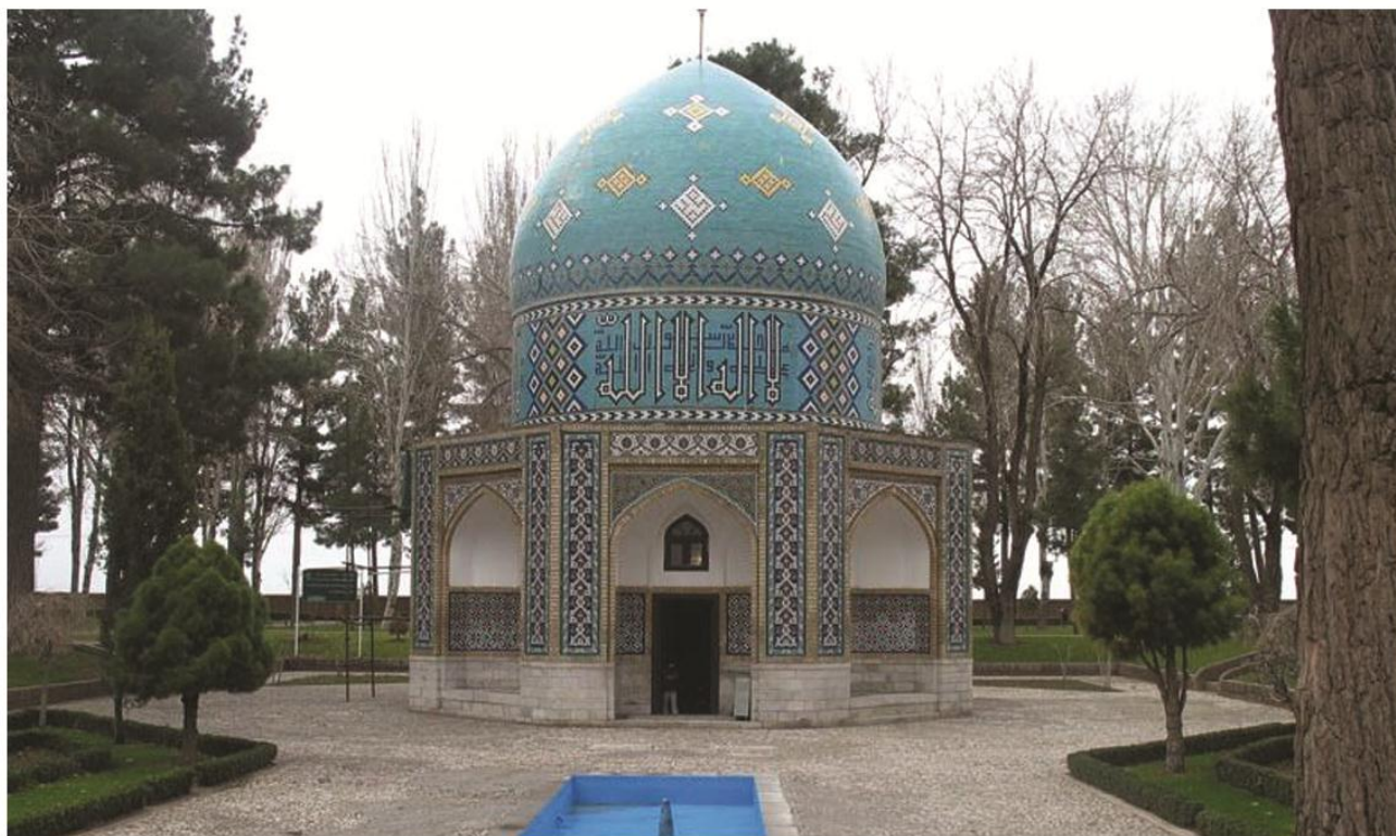
آرامگاه شیخ عطار در نیشابور

در ابتدا بیشتر کتیبه‌ها با آجرکاری نوشته می‌شد، آجرکاری برای نوشتن خط کوفی مناسب بود. با به وجود آمدن خط نسخ و ثلث که دارای منحنی‌های ظریف بودند، استفاده از گچکاری برای کتیبه نگاری مناسبتر و آسانتر بود. بسیاری از کتیبه‌ها نیز بر کاشی‌های رنگین با شیوه‌های متفاوت اجرا شده‌اند.