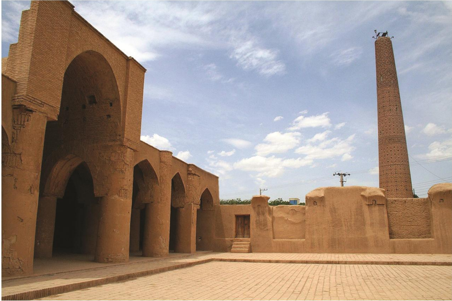
مسجد تاریخانه دامغان، قرن دوم هجری