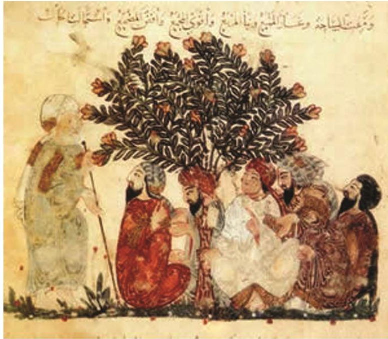
نگاره دو دینار از کتاب مقامات حریری - عربی - بغداد - ۱۲۳۷ میلادی