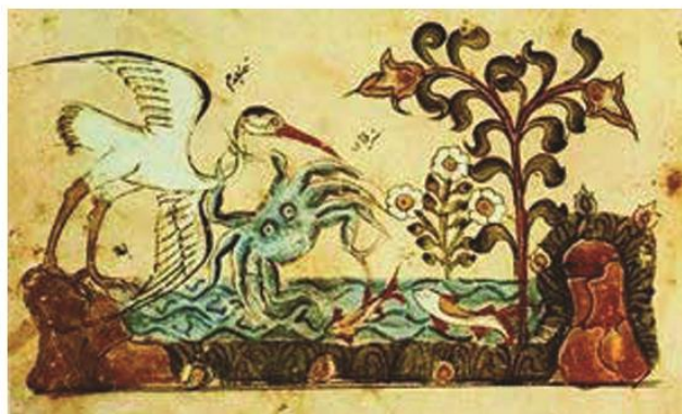
نگاره‌ای از کلیه و دمنه - مکتب بغداد

متن عربی کتاب کلیه و دمنه که به وسیله «عبدالله بن مقفع» از پهلوی به عربی گردانیده شده، نیز در این زمان مصور گشته است. تصویر حیوانات در این کتاب بر سنتهای نقاشی ساسانی استوار است. یک نسخه عالی از این کتاب در کتابخانه ملی پاریس وجود دارد که تاریخ آن در حدود سال ۶۲۸ ه. ق است.