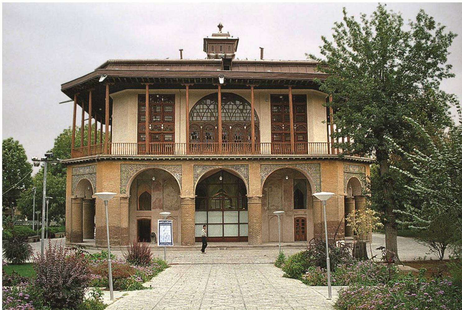
بنای عالی‌قاپو در قزوین (صفوی)