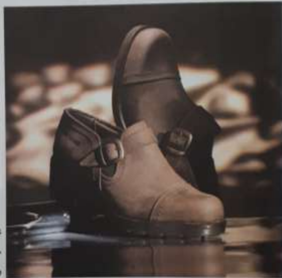
شکل ۲۶-۷- در نورپردازی با سه منبع نور و بیش تر از آن، تمام وجوه اشیای بیدار می شوند.

به کارگیری منابع بیش تر نوری نیز به هنگام بزرگ با وسیع بودن سطوح موضوع مورد عکس برداری با رعایت شرایط یادشده و برقراری تعادل میان شدت نور سطوح مورد عکس برداری قابل اجراء است. با تمرین نورپردازی بر روی اجسام و سطوح بزرگ می توانید تجربیات خوبی را در به کارگیری این روش کسب کنید. در نورپردازی چهره نیز گاه مواردی پیش می آید که ناگزیر از به کارگیری چهار یا پنج منبع نوری خواهید شد که موضوع مورد بحث ما در این قسمت نیست (شکل ۲۶-۷).