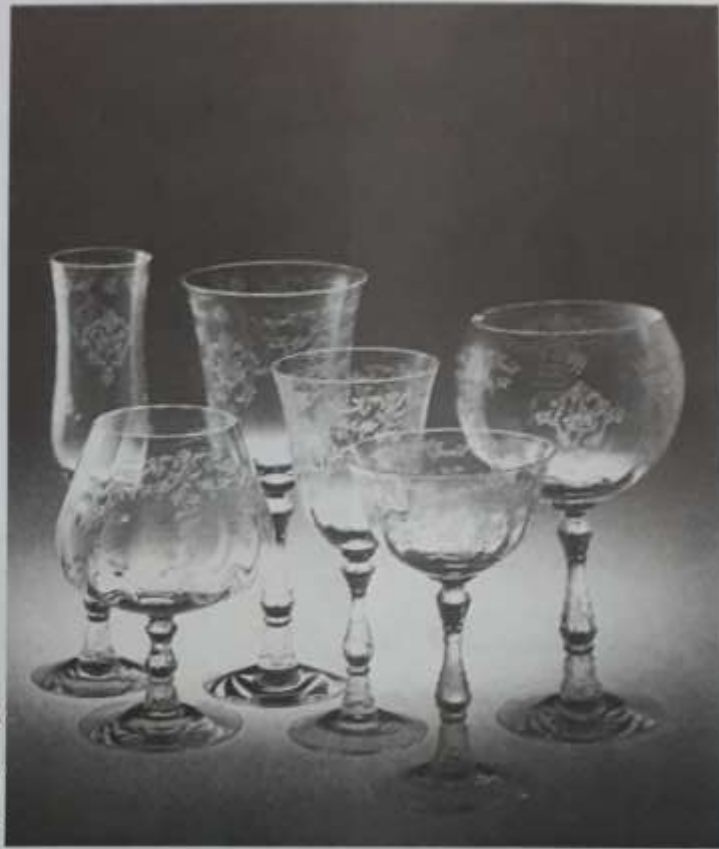
شکل ۲۹-۷ نورپردازی از زیر، سبب ایجاد سایه روشنی تدریجی در پشت موضوع می‌شود.

بازسازی صحنه‌های طبیعی به صورت نمونه‌های کوچک در کارگاه‌های عکاسی و عکس برداری از اشیاء در این گونه صحنه‌ها، جذابیت و جلوه عکس نهایی را چند برابر می‌کند. به‌طور مثال با مقداری ماسه و چند گیاه خشک می‌توان نمایی از کویر را در استودیوی عکاسی ایجاد کرد و شیء مورد نظر را بر روی آن قرار داده، نورپردازی و عکاسی نمود. این گونه روش‌ها و ترفندها در کارگاه‌های حرفه‌ای عکاسی تبلیغاتی، بسیار به کار گرفته می‌شوند (شکل ۳۰-۷).