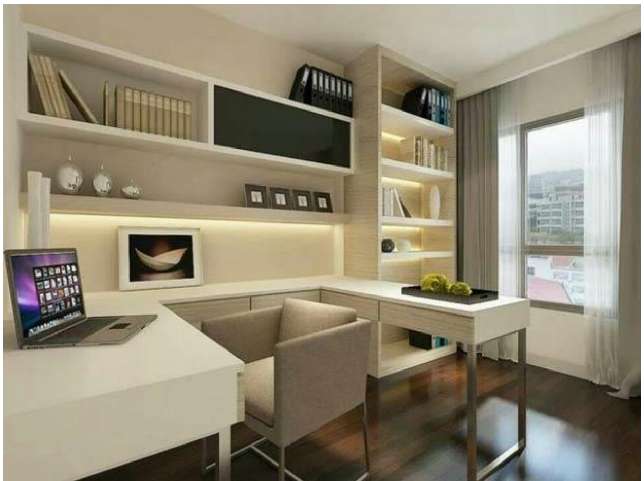
رنگ آمیزی شیک اتاق مطالعه مدرن

همچنین بخوانید: دکوراسیون اتاق مطالعه کنکوری باید چگونه باشد؟