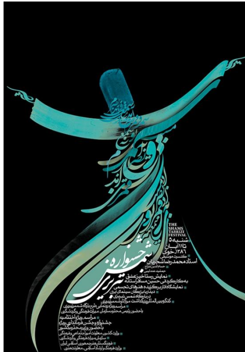
نمونه پوستر نوشتاری

قابل توجه مدرسین محترم : حداقل 4 صفحه در هر هفته برای ارایه محتوای درس و یک صفحه برای خلاصه درس و نمونه سولات در نظر گرفته شود.