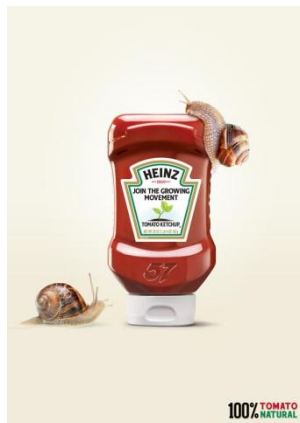
ایده و خلاقیت در طراحی پوستر

قابل توجه مدرسین محترم : حداقل 4 صفحه در هر هفته برای ارائه محتوای درس و یک صفحه برای خلاصه درس و نمونه سولات در نظر گرفته شود.