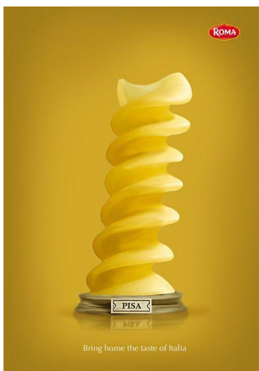
ایده و خلاقیت در طراحی پوستر

قابل توجه مدرسین محترم : حداقل 4 صفحه در هر هفته برای ارائه محتوای درس و یک صفحه برای خلاصه درس و نمونه سولات در نظر گرفته شود.