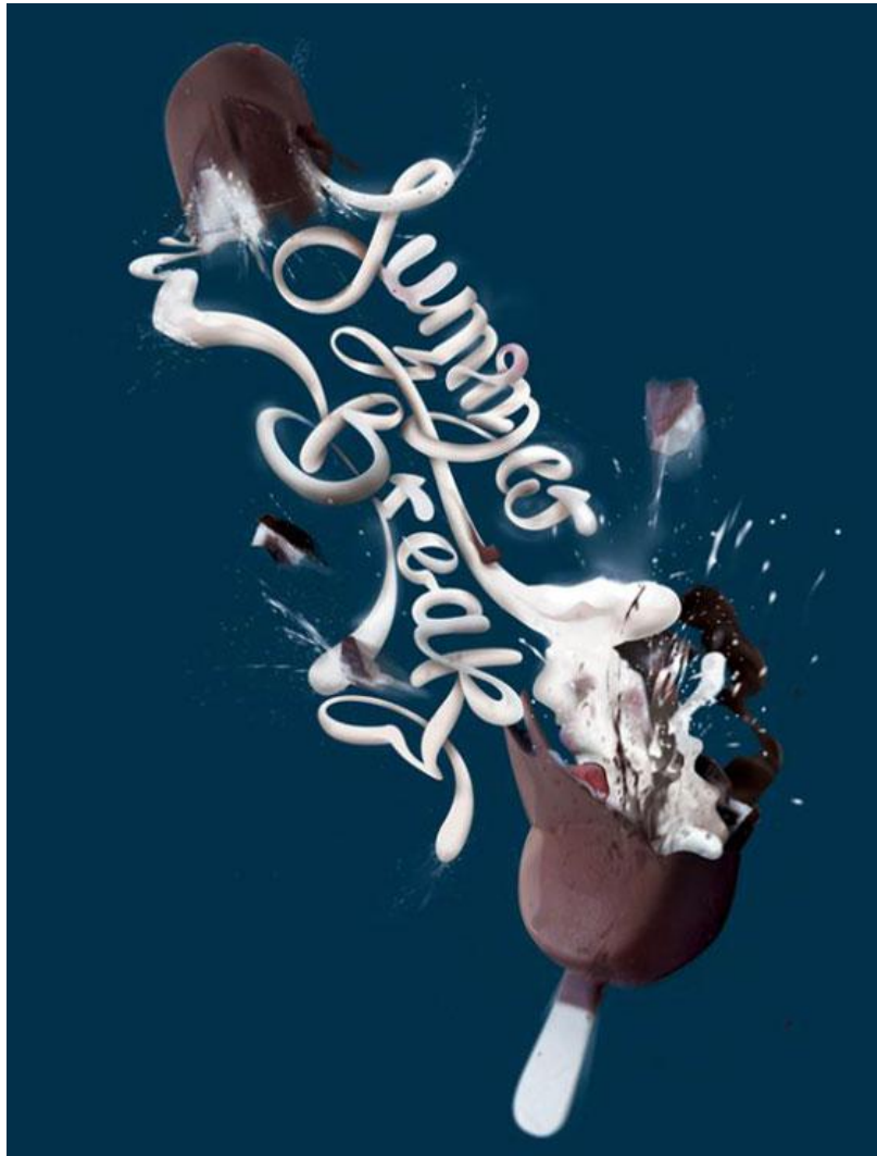
نمونه پوستر تبلیغاتی (تجاری)

- ارائه پروژه عملی جدید با موضوع پوستر طراحی پوستر تبلیغاتی ، انتخاب یک کارخانه داخلی با موضوعیت (صنایع غذایی ، بهداشتی و آرایشی ، سنگین و...)