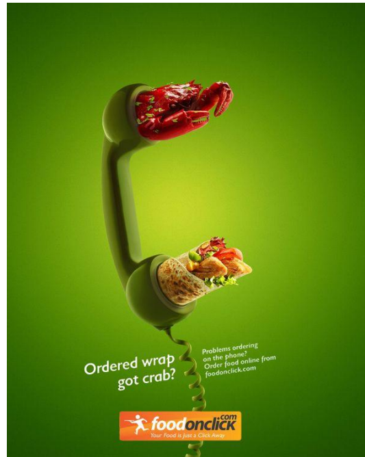
تکنیک فتومونتاژ خلاقانه در طراحی پوستر تبلیغاتی (تجاری)