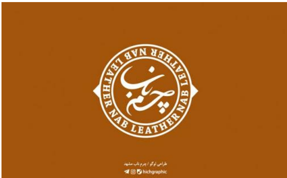
لوگو تایپ برند چرم ناب

قابل توجه مدرسین محترم : حداقل 4 صفحه در هر هفته برای آرایه محتوای درس و یک صفحه برای خلاصه درس و نمونه سولات در نظر گرفته شود.