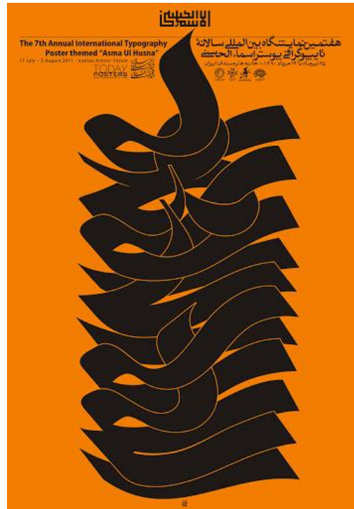
پوستر نمایشگاه هنرهای تجسمی (تایپوگرافی)