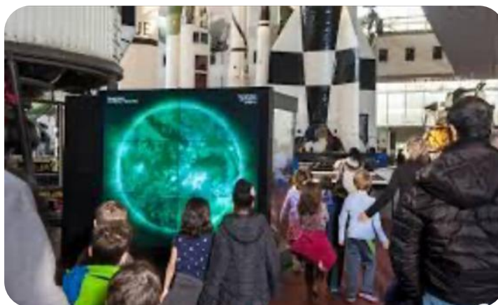
Dynamic sun VIDEO WALL/ SMITHSONIAN Institution

دانشجویان عزیز و گرامی، هر یک از عناوین را می توانید در اینترنت search نمایید و با اطلاعات جالبی روبرو گردید.