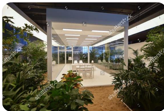
The World to come : Ecology as the New Politics 2030-2100 exhibition, Gerge Museum of Contemporary Art, Moscow, RUSSIA

- طبقه بندی های زیست محیطی یا اکولوژیکی «Ecology» روش ارائه در موزه های علوم طبیعی است بر اساس رابطه میان موجودات زنده و محیط زیست است.