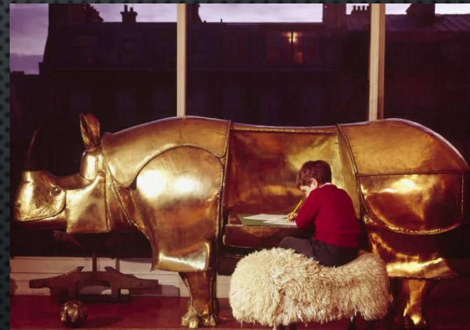
francois xavier lalanne