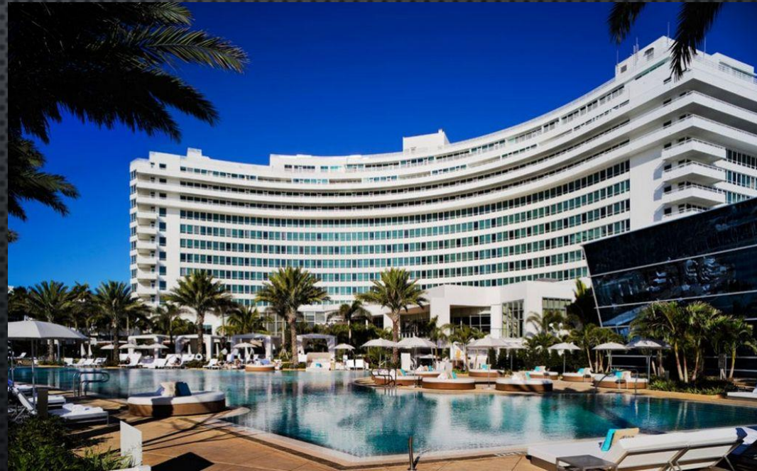
Hotel Fontainebleau Miami Beach ,Morris Lapidus