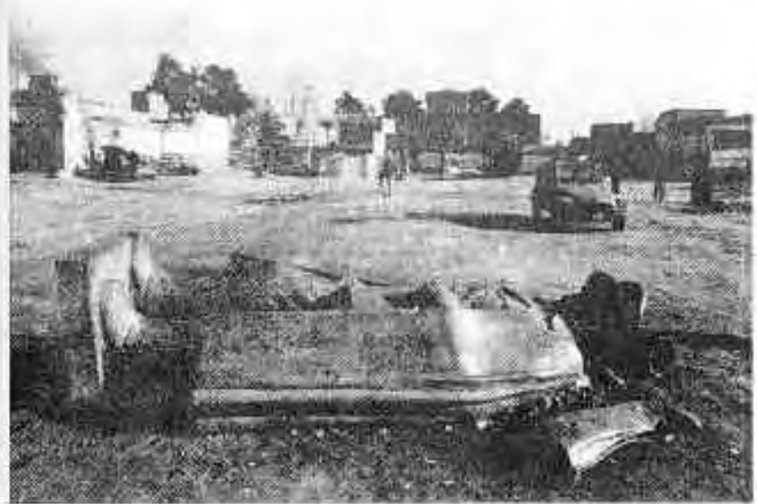
مجسمه محمدرضا شاه پهلوی روی زمین

قدرت مخالفان در راهپیمایی‌های تاسوعا و عاشورای همان سال بیش از پیش نمایان شد. در برگزاری این راهپیمایی‌ها نمایندگانی از طرف [آیت‌الله] خمینی با دولت به توافقی برای نحوه برگزاری آن دست یافتند. بر این اساس دولت موافقت کرد ارتش را از محل برگزاری راهپیمایی دور نگه دارد و محل آن نیز عمدتاً به بخش‌های مرفه شمال شهر محدود شد. مخالفان نیز با راهپیمایی در مسیر تعیین شده و برهیز از شعارهای مستقیم بر ضد شخص شاه موافقت کردند. در ادامه اوج تظاهرات خیابانی چهار مراسم آرام و منظم در میدان شهادت تهران برگزار شد. به گزارش خبرنگاران خارجی شمار جمعیت حاضر در این راهپیمایی‌ها به بیش از دو میلیون نفر رسید. در این برنامه‌ها راهپیمایان قطعنامه‌هایی را تأیید کردند که در آن‌ها تشکیل جمهوری اسلامی، بازگشت [آیت‌الله] خمینی، اخراج عوامل قدرت‌های امپریالیستی از