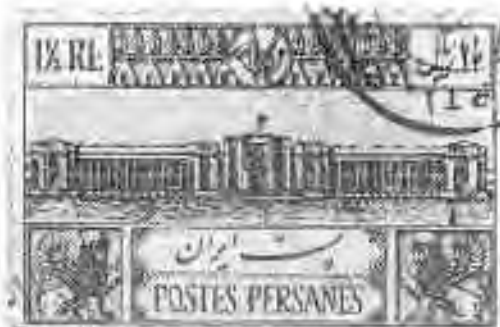
۷۳ ساختمان پست در تهران