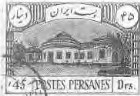
۳۳ اسایتسگاد تهران