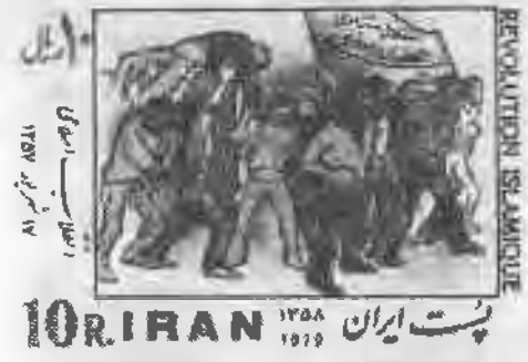
۵۸ تمبرهای مرتبط با سالگرد پیروزی انقلاب اسلامی در سالهای مختلف دهه ۱۳۶۰/۱۹۸۰