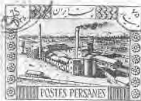
۴۴ خانه مسلمان ری