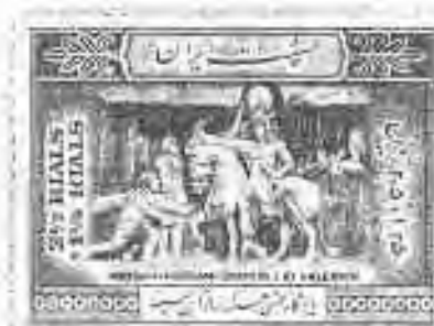
۷۴ کنده‌کاری‌های نقش رستم: تسلیم شدن امپراتور والرین در برابر شاهپور