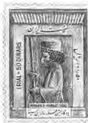
۴۴ تخت جمشید: سرباز جنگی