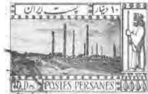
۱۳ تخت جمشید