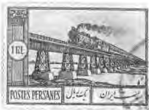
۶۳ پل کارون در خوزستان