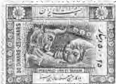
۲۰۴ تخت جمشید: نبرد شیر و گاو