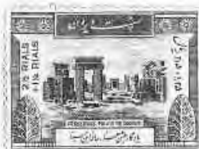
۱۴ تخت جمشید: آثار کاخ اصلی

۴ تمبرهای مرتبط با جشن‌های باستانی ایران