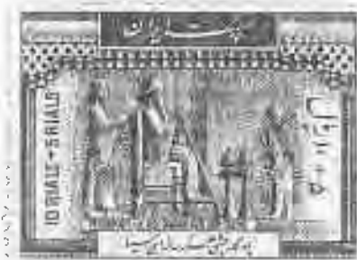
۳۴ تختا جمشید: داریوش