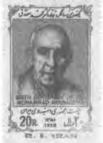
۴۸ تمبرهای منتشره توسط دولت بازرگان: بزرگداشت جلال آل احمد، تسریعی، محمد مصدق و علامه دهخدا