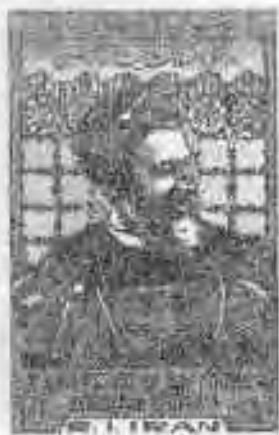
۱.۸ یادبود شهادت آیت‌الله بهشتی و هفتادودو تن از شهدای هفتم تیر