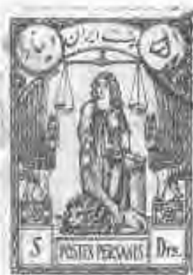
۹۳ نماد عدالت و دادگستری