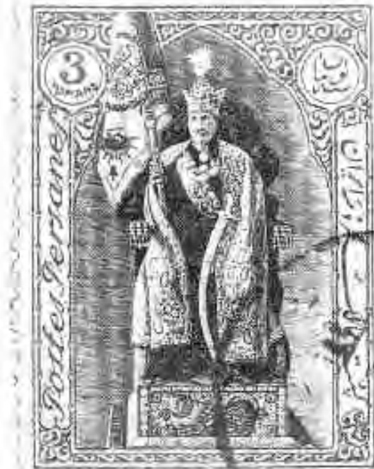
۱ تمبر تاجگذاری، ۱۳۰۵

* خاندان تودور (Tudors) طی سده‌های چهارده و پانزده بر انگلستان حکومت کردند. خاندان بوریون (Bourbons) از دودمان‌های مهم پادشاهی به‌ویژه در فرانسه طی سده‌های شانزدهم تا هجدهم (زمان انقلاب فرانسه) بودند هابسبورگ‌ها (Habsburgs) نبر خاندانی آلمانی‌الاصل و یکی از سلسله‌های عمده حاکم بر اروپا (عمدتاً مناطق آلمانی‌زبان) در سده‌های پانزدهم تا بیستم به‌شمار می‌روند دولت‌های مطلقه تودور، بوریون و هابسبورگ پیش‌درآمد «دولت-ملت‌های» مدرن محسوب می‌شوند. تا پیش از پیدایش دولت‌های مطلقه در سده‌های شانزدهم و هفدهم، حکومت در وجود مرد فرمانروا و حاکم معنی داشت و در واقع بسط و گسترش وی بود اما با پیدایش دولت‌های مطلقه فوق، حکومت از وجود فرد حاکم جدا و به‌عنوان نهادی مستقل مطرح شد که فراتر از خود فرمانرواست و پس از وی هم ماندگار است - م