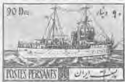
۵۳ ناوچه جنگی