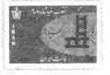
۱.۵ تمبرهای بزرگداشت انقلاب سفید