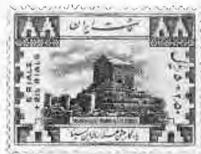
۵۴ پاسارگاد: آرامگاه کوروش