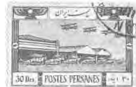
۴۲ فرودگاه تهران