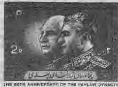
۳.۵ تمبرهای مرتبط با بزرگداشت پنجاه سال شاهنشاهی پهلوی