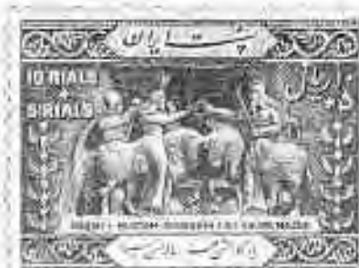
۶۴ کنده‌کاری‌های نقش رستم: اعطای نماد شاهی اردشیر توسط اهور مزدا