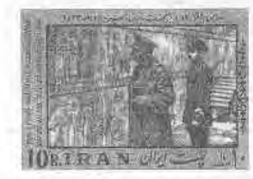
۲.۵ بزرگداشت رضاشاه پهلوی