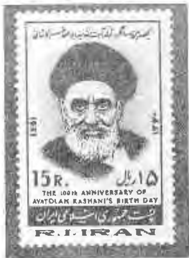
۲.۸ یادبود آیت‌الله کاشانی