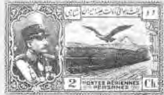
۲ تمبر مرتبط با راه‌سازی در کشور